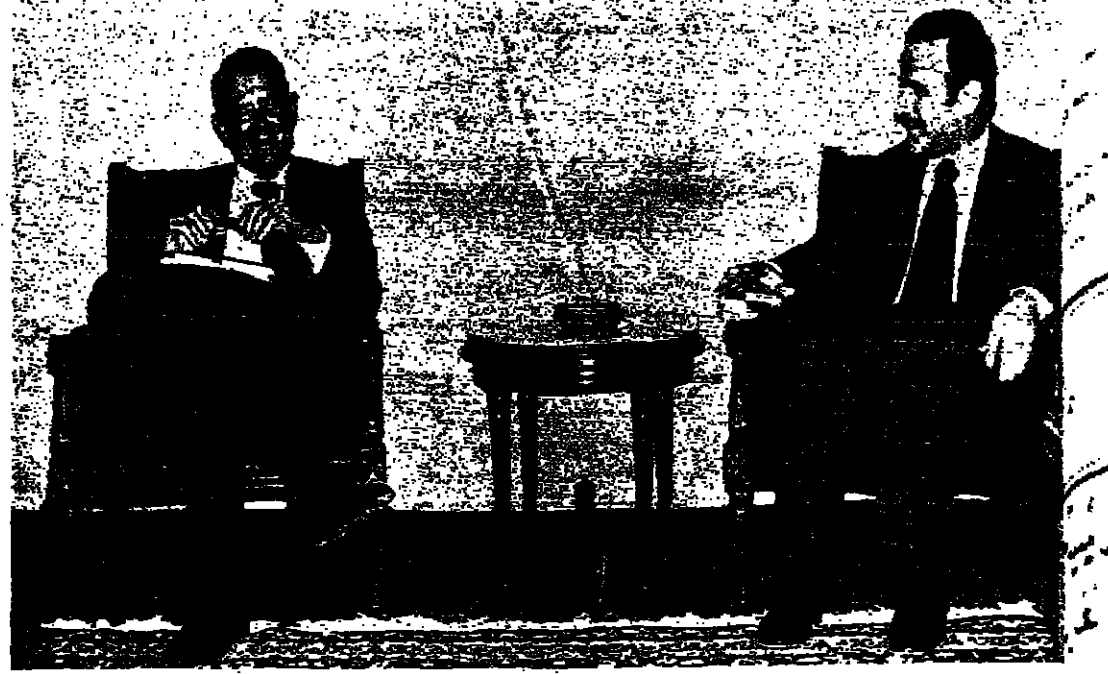
الرئيس الاسد ووزير الخارجية السورية سفيان سباعي قبل بدء المباحثات (صورة من ابيد)